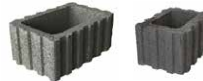
60 x 40 cm