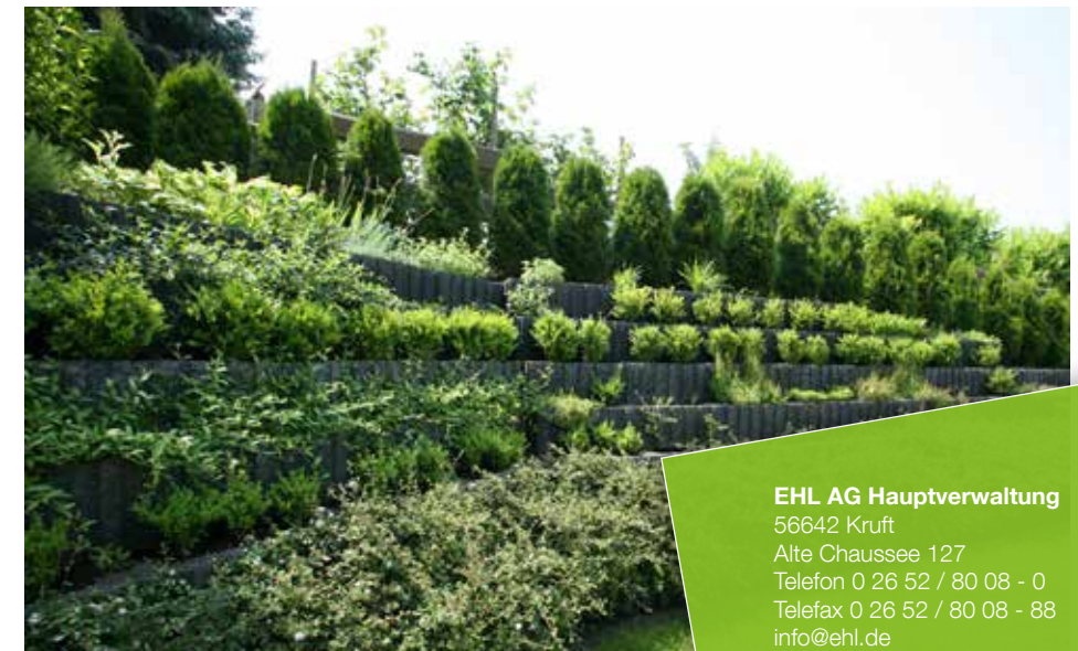
Farbe // anthrazit