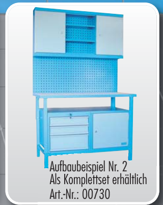
Aufbaubeispiel Nr. 2 Als Komplettsset erhältlich Art.-Nr.: 00730