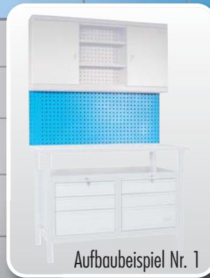
Aufbaubeispiel Nr. 1

Alle Werkzeughalter- und Haken sind passend für Güde-Lochplatten und Systeme mit Lochquadrat 10 x 10 mm, Lochmitte-Abstand 38 mm vertikal und horizontal.